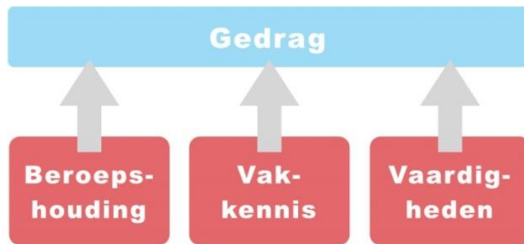
Figuur 2: Beschrijving van de kwalificaties

Bij gedrag gaat het om waarneembare handelingen die nodig zijn voor het goed uitvoeren van een kerntaak. Het gedrag is de resultante van kennis, vaardigheden en de beroepshouding.